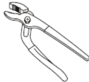
Groove Joint Pliers