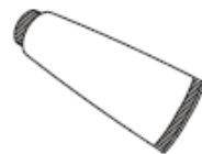
Silicone Sealant Enduit d'étanchéité au silicone Sellador de silicona